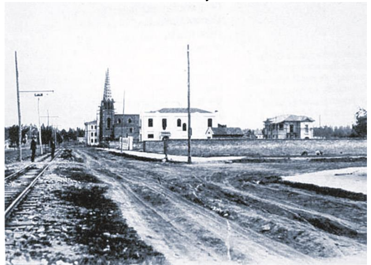
Fotografía Avenida Chile- Archivo Histórico, Periódico el Tiempo. Cortesía 2014

Desde ese momento empezó mi búsqueda, con la curiosidad de hallar la verdad de esa medicina que había curado su artritis. En mi casa, mi madre me daba globulitos para las dolencias propias de la infancia. Fui el mayor de tres hermanos, crecimos en el barrio cerca al parque de la Independencia y luego en la Avenida Chile.